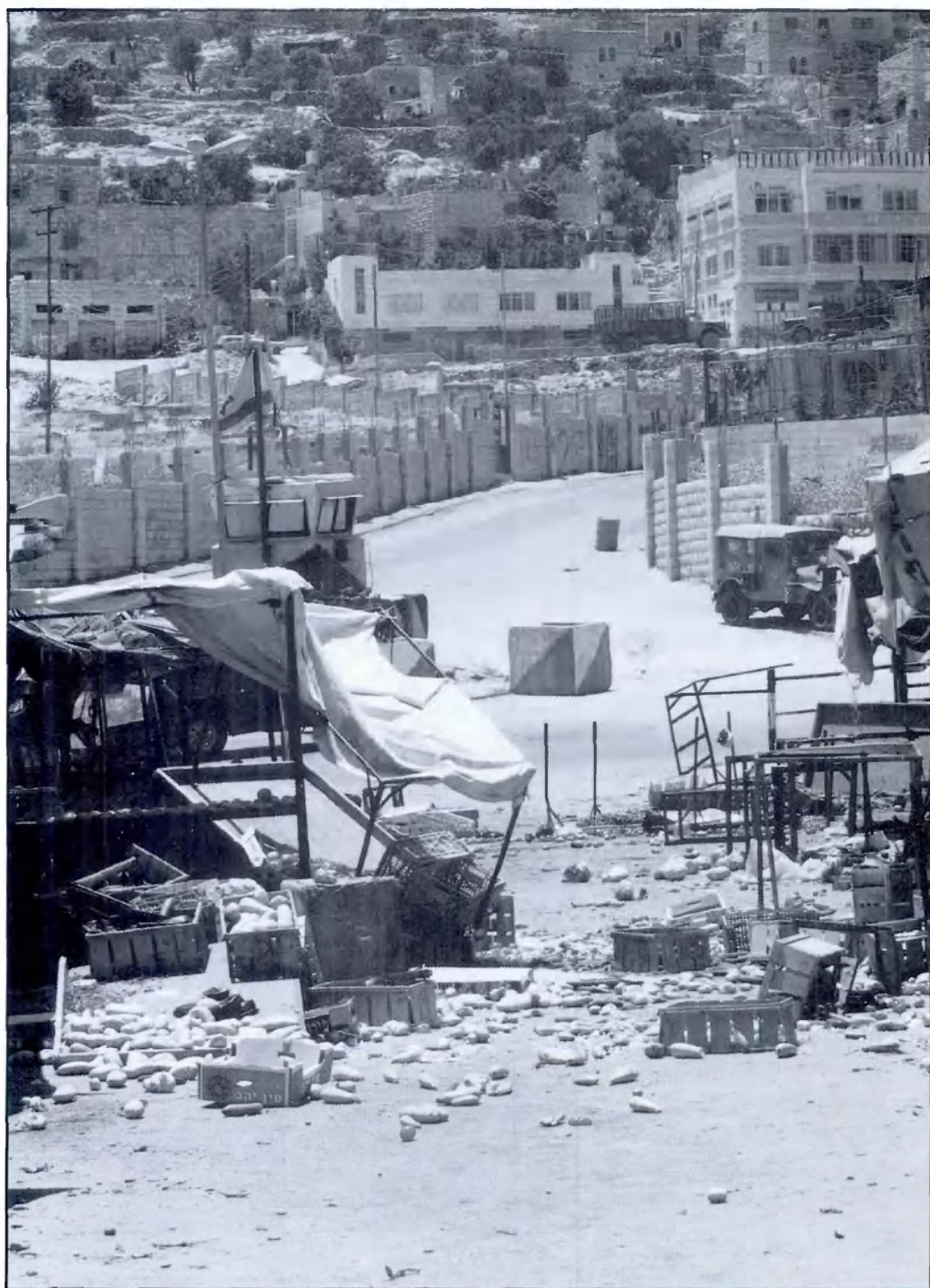
רחוב בשוק בחברון לאחר התפרעות מתנחלים, יוני 1995.