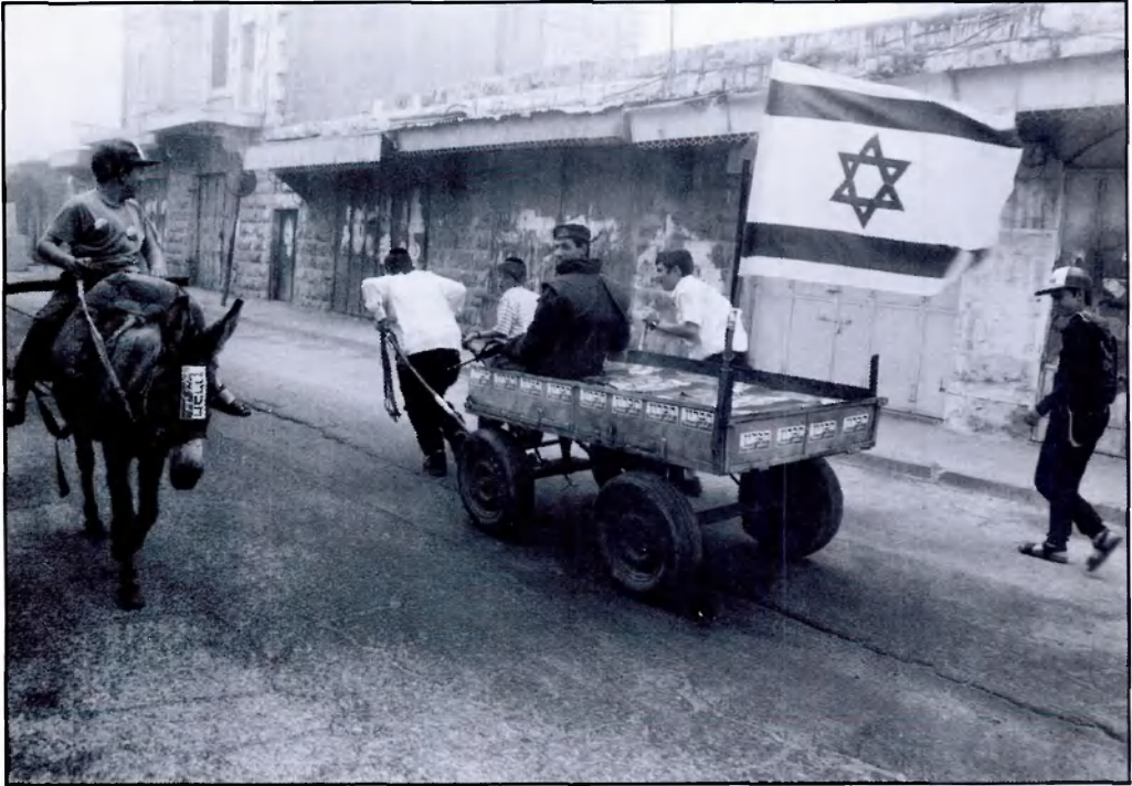
מתנחלים ביום עוצר בחברון, מאי 1995.

השימוש התכוף בעוצר בחברון מהווה כשלעצמו הפרה של זכויות האדם, בהטילו הגבלה קולקטיבית על האוכלוסייה. נוסף לכך, העוצר מוטל בצורה מפלה, על התושבים הפלסטינים בלבד, בעוד המתנחלים חופשיים לנוע, וזאת ללא כל קשר לעילת הטלתו: כוחות הביטחון נוהגים להטיל עוצר על הפלסטינים הן בעקבות מעשי אלימות של פלסטינים נגד מתנחלים והן בעקבות מעשי אלימות של מתנחלים נגד פלסטינים במקרה הראשון, טוענים כוחות הביטחון שיש להטיל עוצר כדי לעצור את האחראים